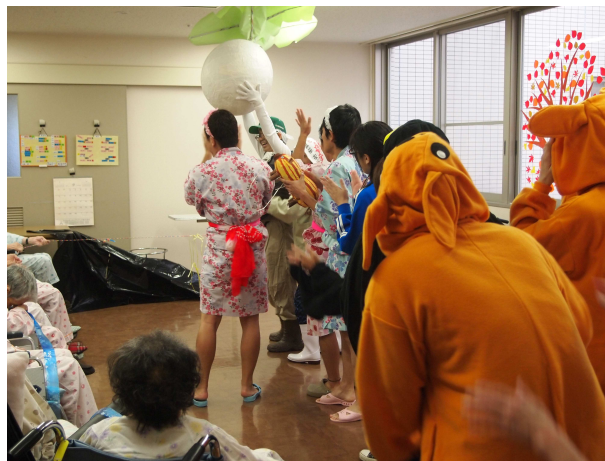
△衣装も用意して見事な熱演でした！