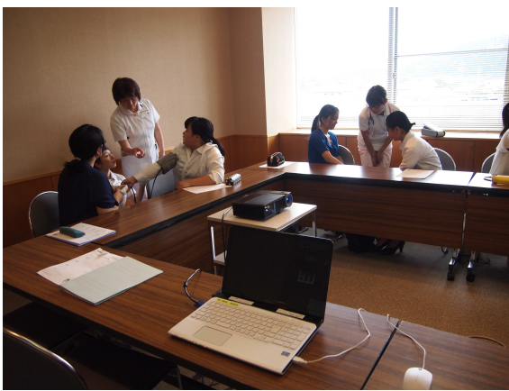
△実際に血圧を測ってみました。

する理解を深め、不安に感じる要素を少しでも払拭していただければ、との思いを込めて開催していただきます。セミナー終了後には、「説明も分かりやすく、参加して良かった。」「このセミナーに参加して、ぜひ就職したいと感じました。」などの嬉しい感想が聞かれ、担当した職員一同も「実施して良かった」との想いを深めています。参加された皆さまには、このセミナーを機会に坂下病院を少しでも身近に感じていただけたなら幸いです。 当セミナーはご友人と誘い合わせての参加も可能ですので、次回開催の折にはより多くの皆さまとお会いできることを楽しみにお待ちしております。