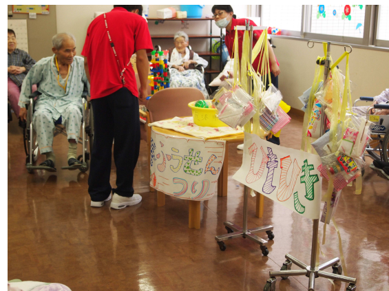
△職員の手作りです。

笑顔と笑い声が絶えない、とても楽しいひとときを過ごし、少しの間ですが、暑さを忘れることが出来ました。