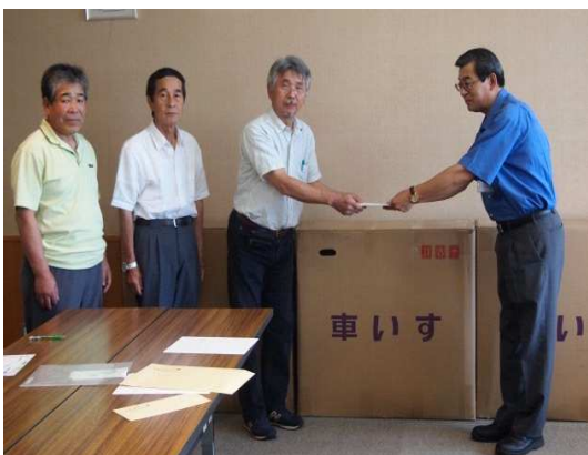
△戌亥会古希行事実行委員会様より 車いす4台