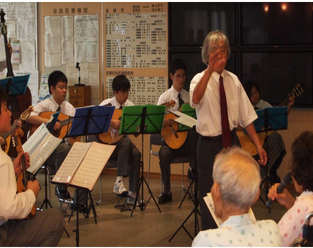
△素敵な演奏をありがとうございました

「キラキラ星変奏曲」から始まり、アンコールの東日本大震災復興支援ソング「花は咲く」を含め全6曲を披露していただきました。当日は、病棟に入院されている患者さんなど百名ほどの方がエントランスに集まり、ギターマンドリンの音色に合わせて、みんなと一緒に歌ったり、楽しい時間を過ごすことができました。