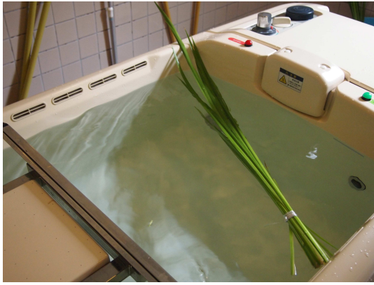
▲とても良い香りでした！

端午の節句に菖蒲の根や葉をお風呂に入れることで、豊かな香り、血行促進、保湿効果などがあるとされています。4東では6月18・19日の2日間、患者さんに菖蒲湯を楽しんでもらいました。皆さんポカポカになり、心も暖かくなりました。