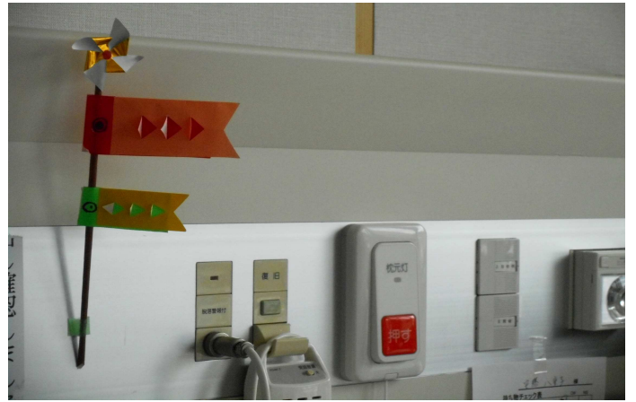
▲病室のベッド周りにミニ鯉のぼりを飾りました

▼坂下高校、瑞浪麗澤高校の生徒23名のボランティアのみなさん ありがとうございます