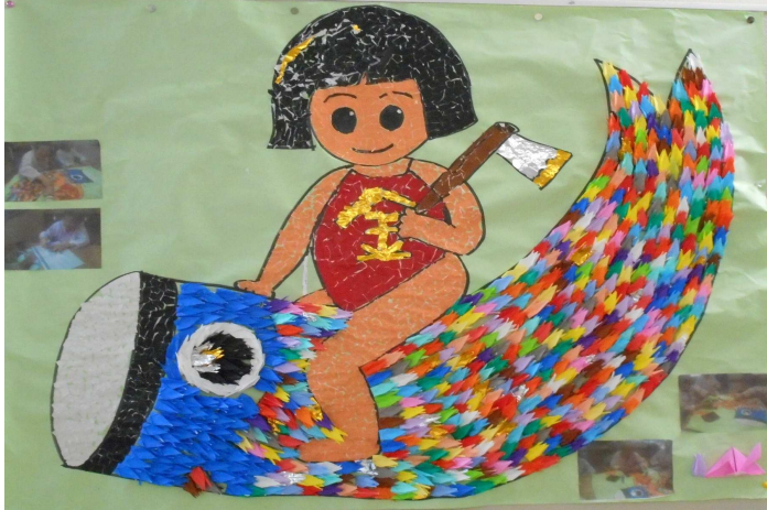
▲鯉のぼりは千羽鶴でできています