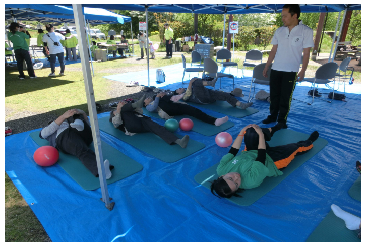
(昨年の看護の日の様子)