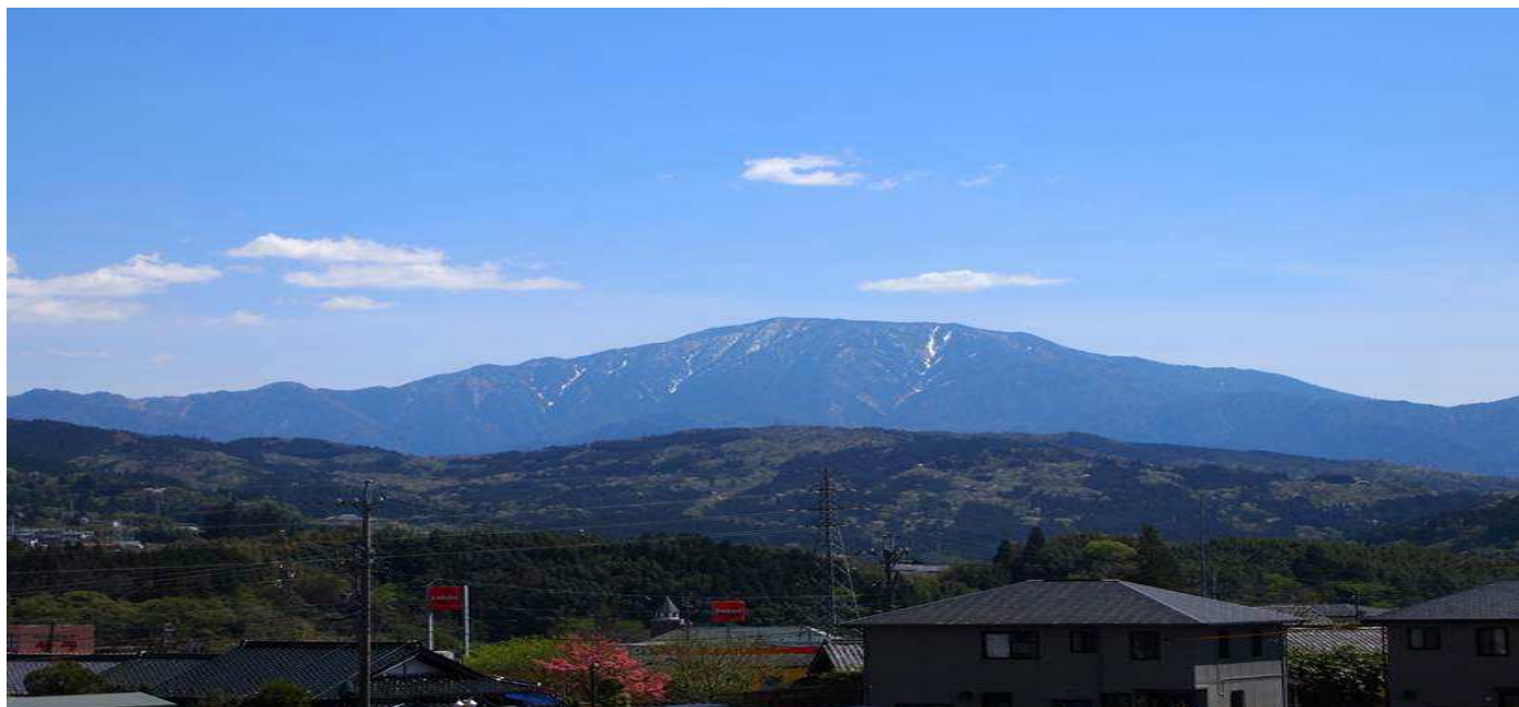
(坂下病院から望む恵那山)