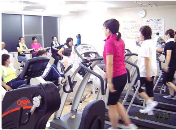
(機械を使ったトレーニング)