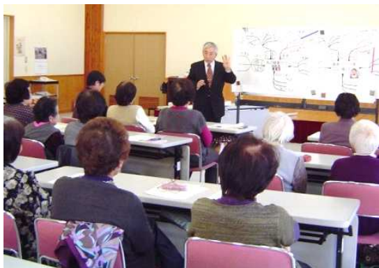
病院長による 巡回健康講話の様子

また、当院には歯科保健センタ ーもあり、入院患者様と坂下老人保健 施設入所者の方への「口腔衛生管理」 「相談」も実施しています。