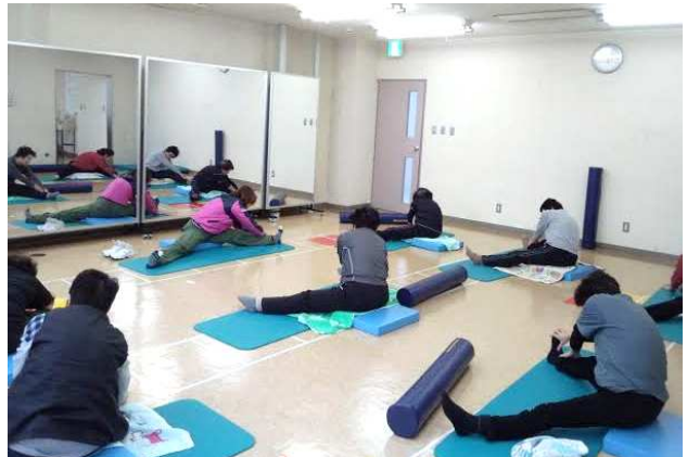
(健康運動指導士によるストレッチ運動)