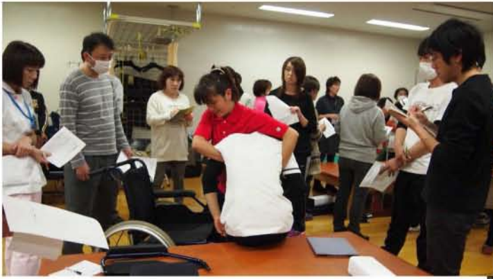
↑実技中心の、熱い研修会になりました。→